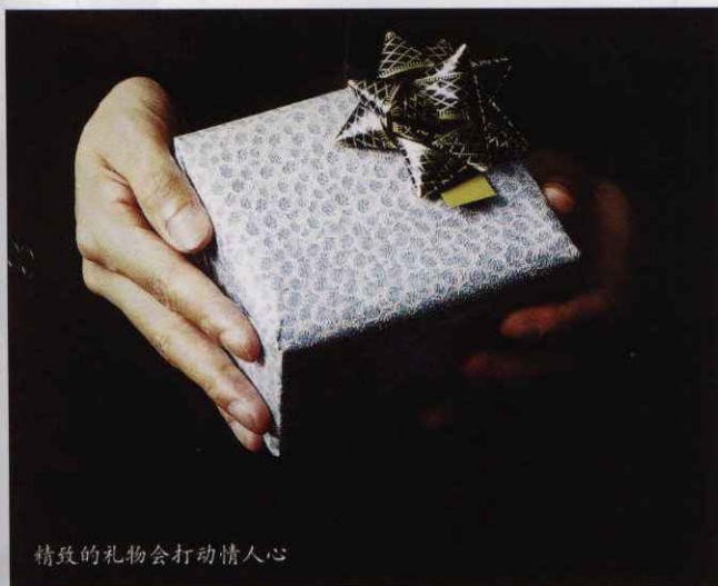
精致的礼物会打动情人心

如果你收到一份令人欣喜的情人节礼物，不妨在“白色情人节”这一天让对方也感受到你的爱意。打开送礼锦囊，总有一款适合他（她）——